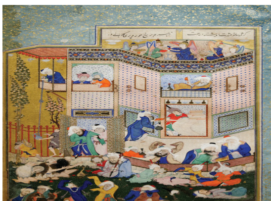
تصویر ۵. مستی لاهوتی و ناسوتی، اثر: سلطان محمد نسخه دیوان حافظ سام میرزا، مجموعه لویی کارتیه، دانشگاه هاروارد، (مأخذ: کورکیان و سیکر، ۱۳۷۷: ۱۰۳)

روایت شده، شیطان در قالب انسانی با ظاهری پیراسته و موجه در رویارویی با ضحاک جوان ظاهر شده و با سخنان وسوسه انگیزش، زمینه‌های فریب ضحاک را در کشتن پدرش، مرداس شاه و تکیه زدن بر تخت شاهی به جای او، فراهم می‌نماید (فردوسی، ۱۳۸۶: ۲۵) (تصویر ۴). در جایی دیگر، سیمرغ در قاب نمادی از دانش و حکمت و فرزاندگی ایزدی، در مواقع درماندگی و فروماندگی به یاری زال و پسرش رستم آمده و چاره‌ساز می‌شود (فردوسی، ۱۳۸۶: ۹۱۹).