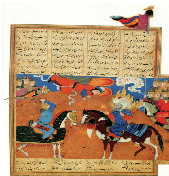
تصویر ۳. در آمدن جبرئیل به آوردگاه نبرد، خاوران‌نامه ابن حسام، اثر: فرهاد شیرازی، ۸۹۲-۸۸۲ ه.ق (مأخذ: حسینی راد، ۱۳۸۴: ۷۸).

نگارگری ایرانی در دوران پس از اسلام، به سبب ارتباط نزدیک موضوعی و معنایی با ادبیات ایران، به تجلی‌گاهی مناسب برای تجسم مفاهیم و مضامین نهفته در متن آثار ادبی منظوم و منثور این سرزمین مبدل شده است. از جمله این مضامین، حکایات و افسانه‌ها و اشعار عرفانی خیال‌انگیز و حماسه‌های اساطیری است، که در طی چندین سده محمل اشعار و متون ادبی ادیبان ایرانی بوده‌اند. با توجه به آنچه درباره نمودهای آنتروپومورفیسیم در ادبیات ایرانی، تحت عنوان آرایه «تشخیص» از نظر داریم، مصداق‌های متعدّد و متنوعی از نسخه‌های مصور ادبی، براساس متون اصلی آثار یاد شده، به‌عنوان میراث فرهنگی، هنری و ادبی برجای مانده است. نکته