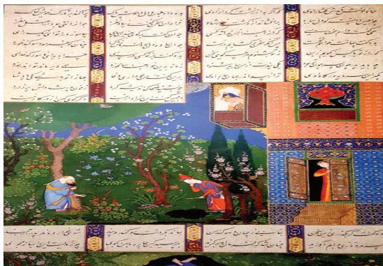
تصویر ۴. کشتن ضحاک پدرش را، منسوب به سلطان محمد نقاش، شاهنامه شاه طهماسبی، سده ۱۰ ه.ق نقاش، ۹۳۱ ه.ق (مأخذ: Canby، ۲۰۱۴: ۷۴)